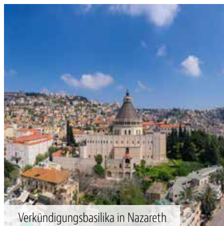
Verkündigungsbasilika in Nazareth

In Tabgha, dem traditionellen Ort der sogenannten Brotvermehrung, besuchen Sie die Benediktinerkirche mit dem bekannten Bodenmosaik aus dem 5. Jh. – es zeigt zwei Fische und vier Brote, ein Motiv, das auf die Erzählung von der Speisung der Fünftausend verweist (Mk 6,30–44; Mt 14,13–21).