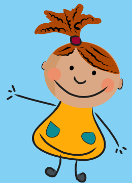
Für das KiTa-Team: Gaby Thiel

Durch eine ganzheitliche, spielerische und individuelle Förderung schaffen wir die Basis für lebenslanges Lernen – mit Freude, Selbstvertrauen und sozialer Kompetenz. Die Kita hat für diesen Jahrgang die Vorschularbeit optimiert und arbeitet zum Jahresthema „Berufe“ mit den Kindern. Für diesen Jahrgang laufen derzeit 20 Kinder im Vorschulprojekt mit. Seit September läuft bereits das Vorschulprojekt an, es ist eine Zusammenarbeit mit Eltern unserer Kita. Die Projektein-