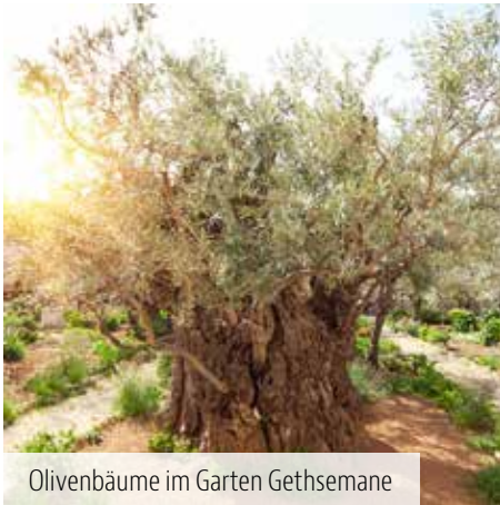
Olivenbäume im Garten Gethsemane

neuert. Sie gilt als eine der ältesten kontinuierlich genutzten Kirchenbauten der Welt. Die Grotte unter dem Altar markiert traditionell den Ort der Geburt Jesu (Lk 2,1–7). Übernachtung in Jerusalem (Frühstück, Abendessen).